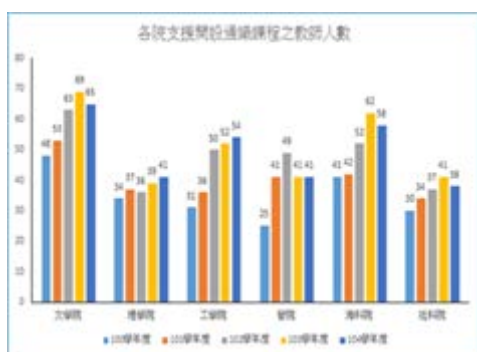
圖 1：各院支援開設通識課程教師人數